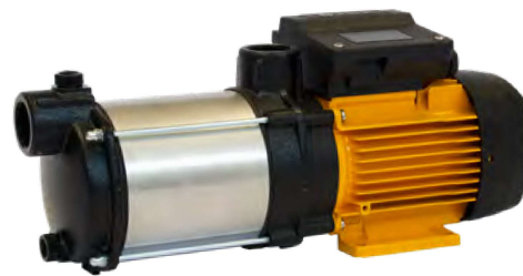
Tabla de características