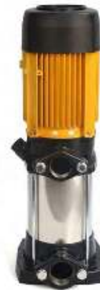
Tabla de características